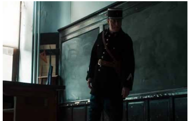
b. Il est dans l'école OU dans la salle de classe.