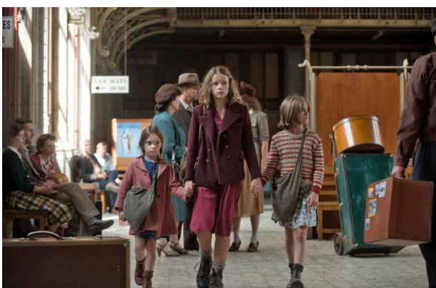
e. Elles sont à la gare.