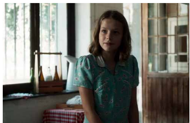
f. Elle est dans la cuisine (de la pension).