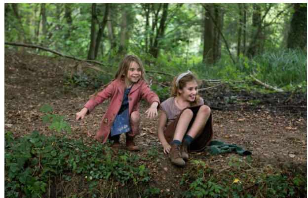
d. Elles sont dans la forêt.