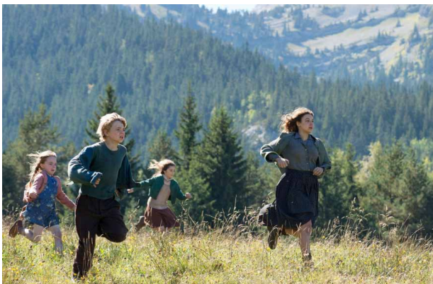
c. Ils sont à la montagne OU dans la nature.