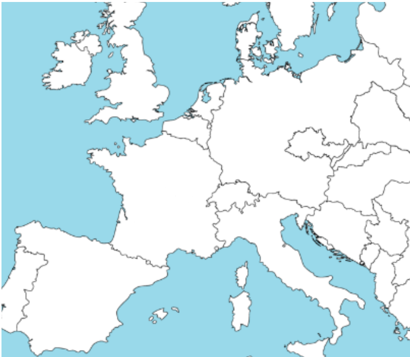
L'Europe en 1943 (au moment de l'histoire du film)

Observe les deux cartes de l'Europe ci-dessous. Quelles différences remarques-tu ?