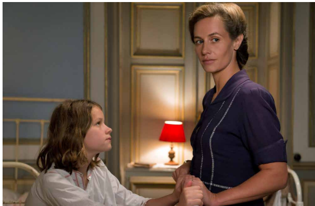
a. Elles sont dans la chambre.

Où sont les personnages ? Regarde les photos et complète les phrases.