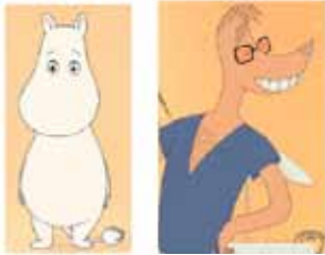
Moomin et Clark