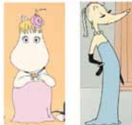
Snorkmaiden et Audrey Glamour