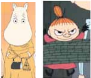
Mamma et Little My